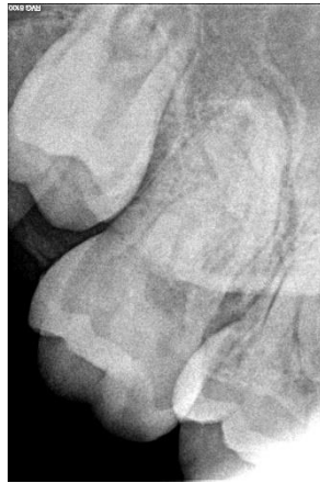
Figura 2: Tomografía de campo reducido del diente 1.7

A: Vista axial tercio apical: presencia de 4 conductos radiculares