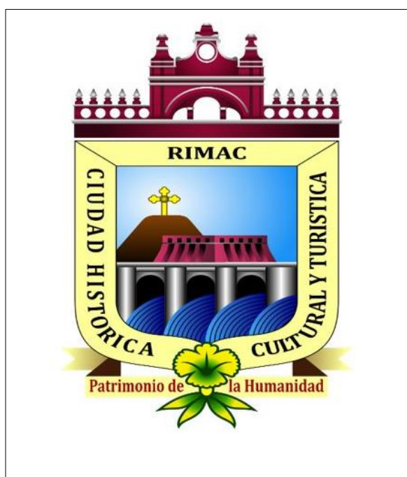
Figura 1. Imagen del escudo del distrito del Rímac utilizado en la guía de pautas para las preguntas de recordación asistida.