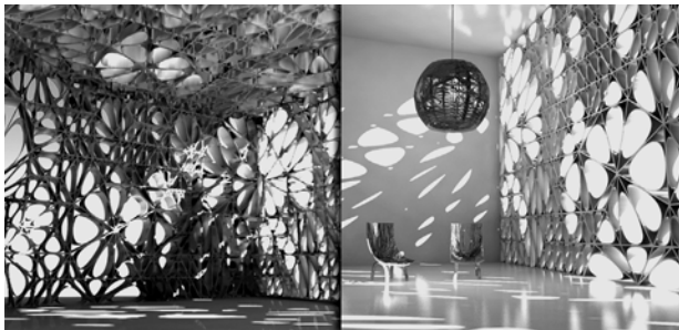
Figura 1. Superficie esponja